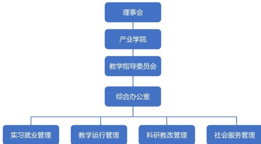
图 2 产业学院组织架构

同时，嵌合职业技术师范学院教学、实习、培训行政管理架构，兼顾产业学院教学运行、实习就业以及培训项目等相关组织协调工作。